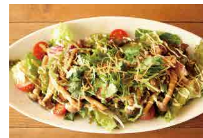
パクチーたっぷりグリルチキンと茸のチャイニーズサラダ 1250yen