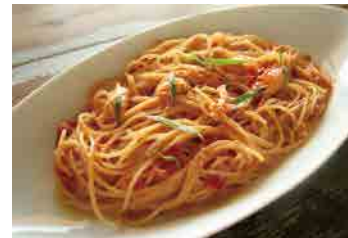
パスタの大盛り+500yen (1.5倍量)

ゴルゴンゾーラチーズのクリームペンネ (少なめ60gです。) 850yen 和牛すじのアラビアータ (少なめ60gです。) 850yen