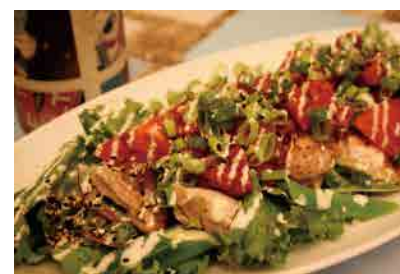
激辛チキンサラダ 1250yen