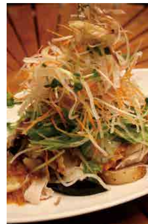
豚しゃぶと揚げ山芋のサラダ 1200yen