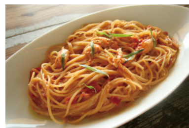
パスタの大盛り+500yen (1.5倍量)